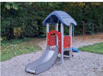
Erweiterung Spielgeräte in Nähermemmingen