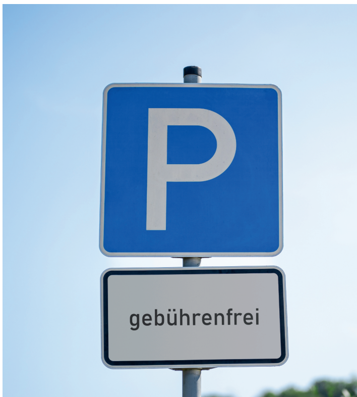
Gebührenfreie Parkplätze in der Innenstadt