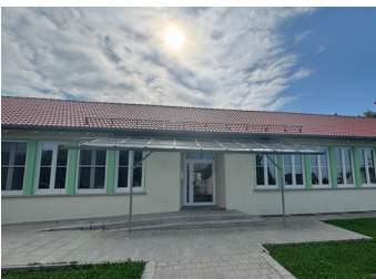
Sanierung Kita Grosselfingen