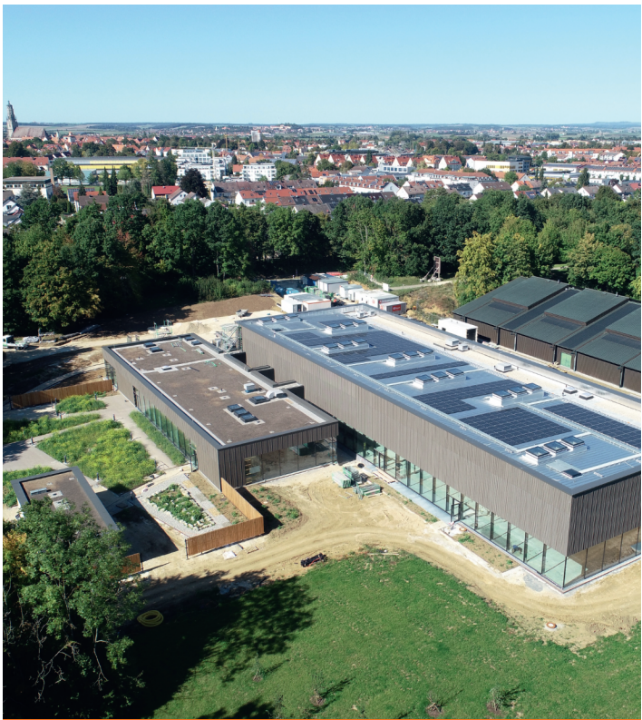
Kraterbad mit Sauna