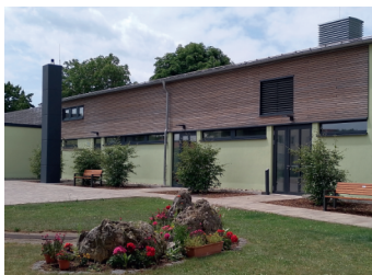
Sanierung Gemeindezentrum Kleinerdlingen