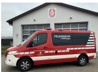
Mannschaftswagen für Pfäfflingen