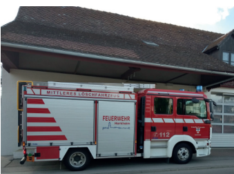
Löschfahrzeug für Herkheim