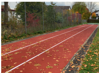
Neue Tartanbahn für Baldingen